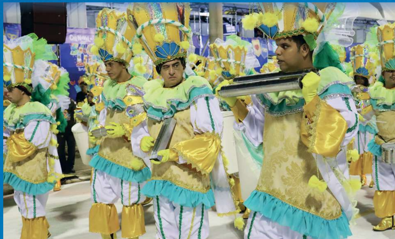
BLOCO TRADICIONAL DA APAE DE SÃO LUÍS

O objetivo da APAE São Luís vai além da reabilitação e inclusão de pessoas com deficiência intelectual e/ou múltipla. Utilizando a Cultura como ferramenta essencial, a instituição busca promover a integração e inclusão social. A Cultura torna-se um elo vital para alcançar a missão da APAE de possibilitar que essas pessoas atinjam seu máximo potencial, contribuindo de forma significativa para a sociedade.