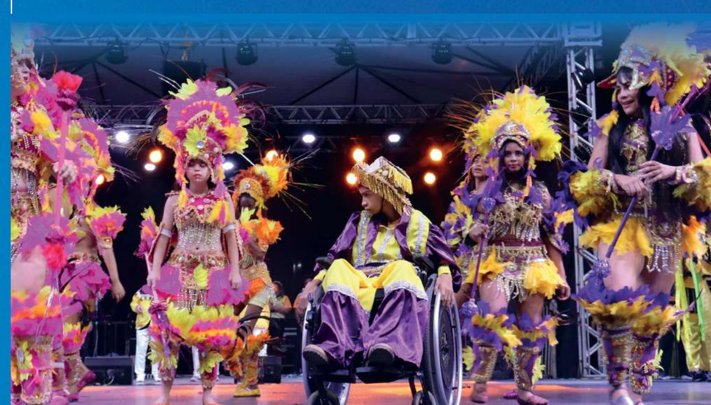
BUMBA-BOI MIMOSO DA APAE